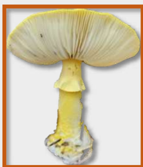
Amanite à voile jaune