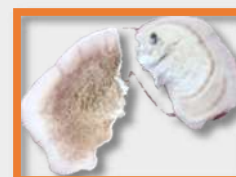
Polypore parchemin Benoît Fortin