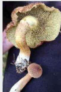
Bolet à pied creux