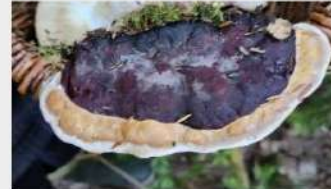
Polypore de Mounce