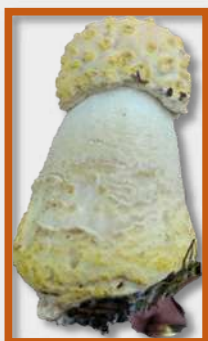
Amanite tue-mouche variété de Gussow