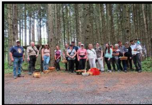
Excursion aux chanterelles du 13 juillet 2025

Amanite à voile jaune Amanite précoce Amanite tue-mouche variété de Gussow Chanterelle commune Collybie furfurcée Dermatose des amanites Mycène sp. Polypore des clôtures Polypore parchemin Russule variable