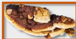
Polypore des clôtures