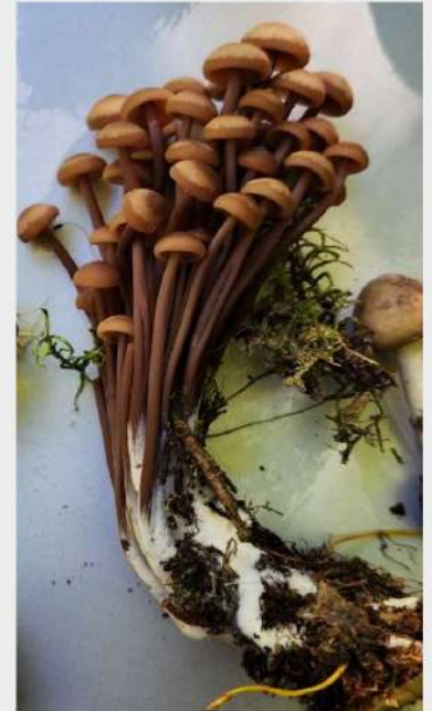
Collybie en touffe