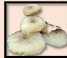
Collybie à ocelle