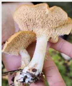
Pied de mouton