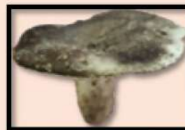
Russule noir et blanc